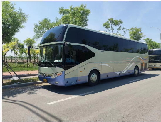
51座大巴*3辆 1号车、2号车、3号车