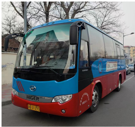
33座大巴*3辆 4号车、5号车、6号车