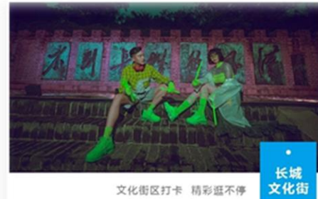
文化街区打卡 精彩不停