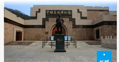
中国长城博物馆了解长城的“前世今生”