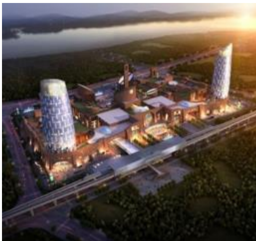
西安砂之船奥特莱斯