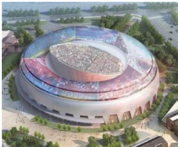
西安华夏演艺中心