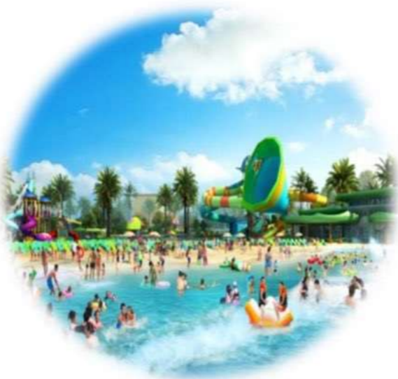
万达主题乐园 距离约3公里