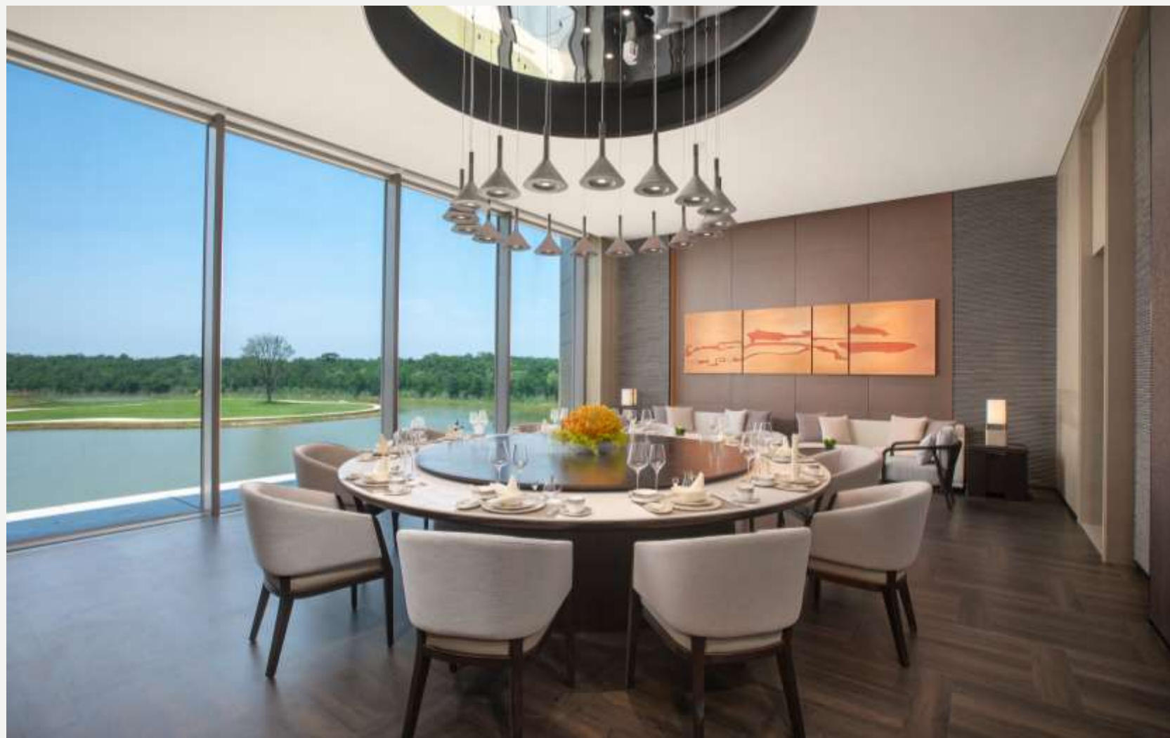
北戴河英迪格酒店