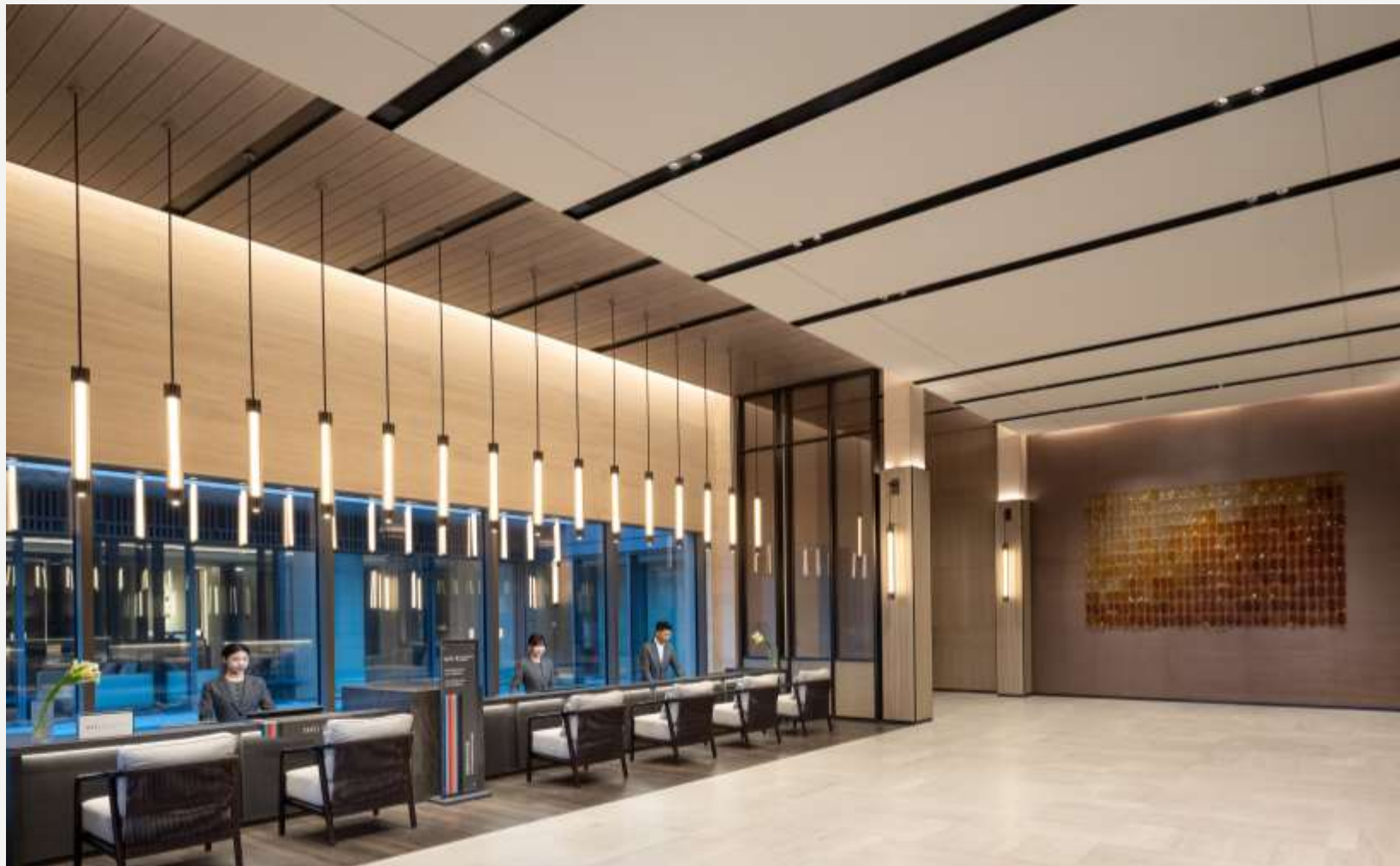
北戴河英迪格酒店