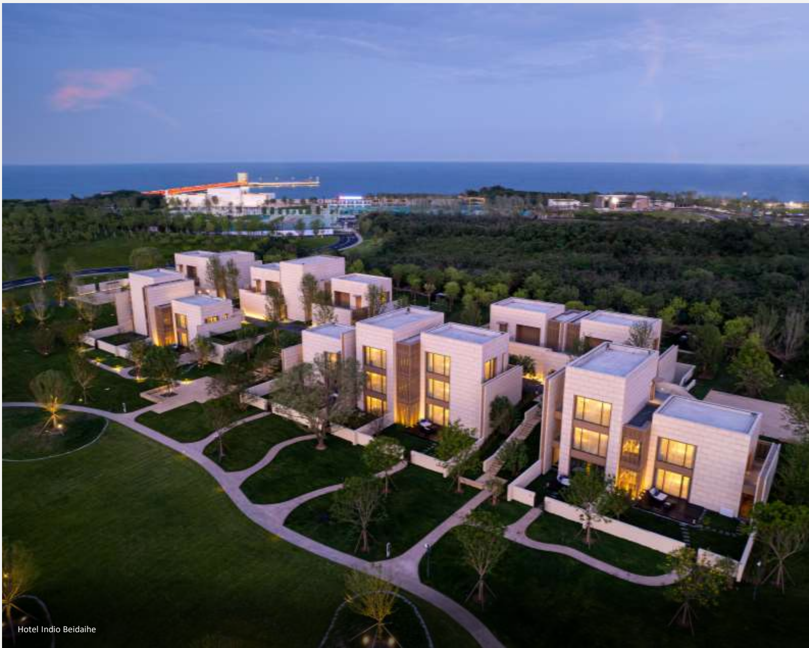
Hotel Indio Beidaihe