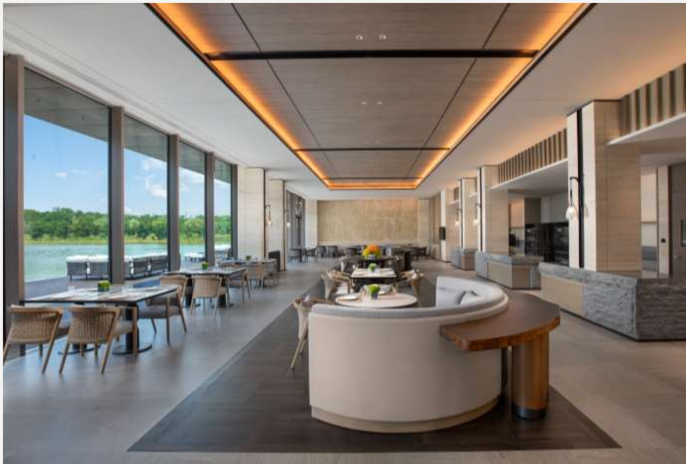
北戴河英迪格酒店