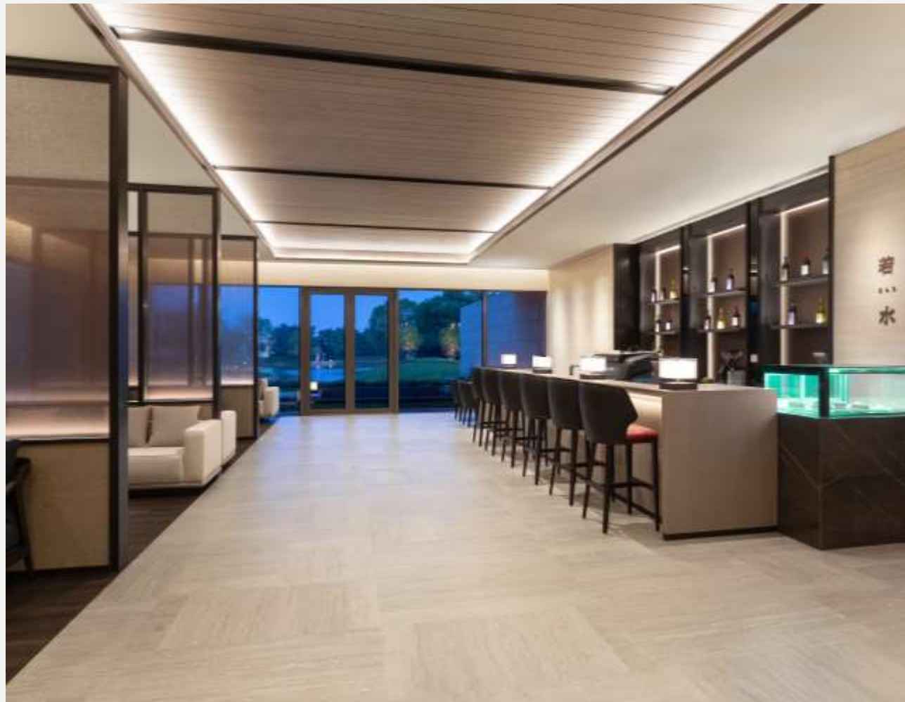
北戴河英迪格酒店