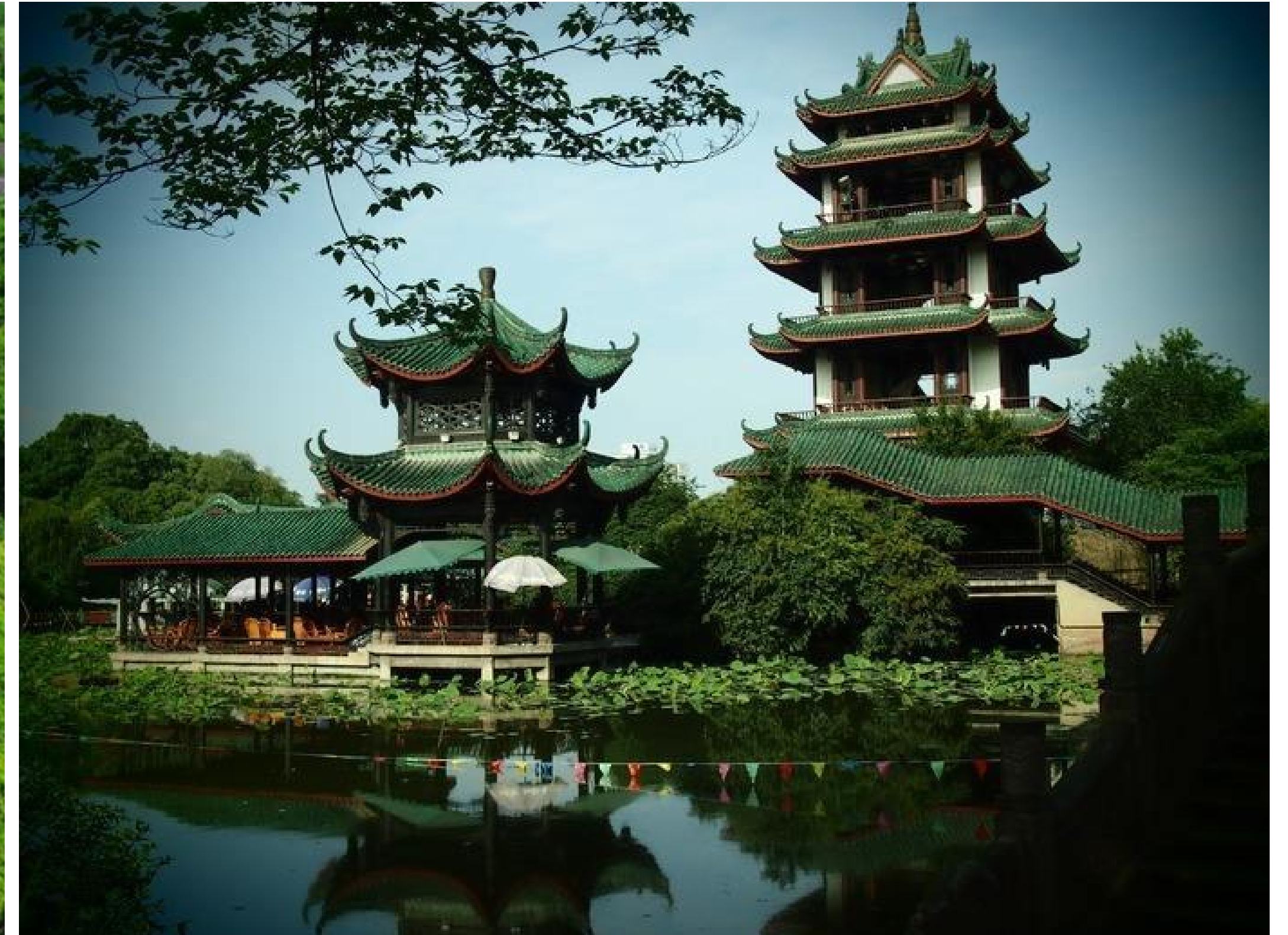
中国八大赏荷地，五大赏桂地桂湖公园距酒店步行5分钟