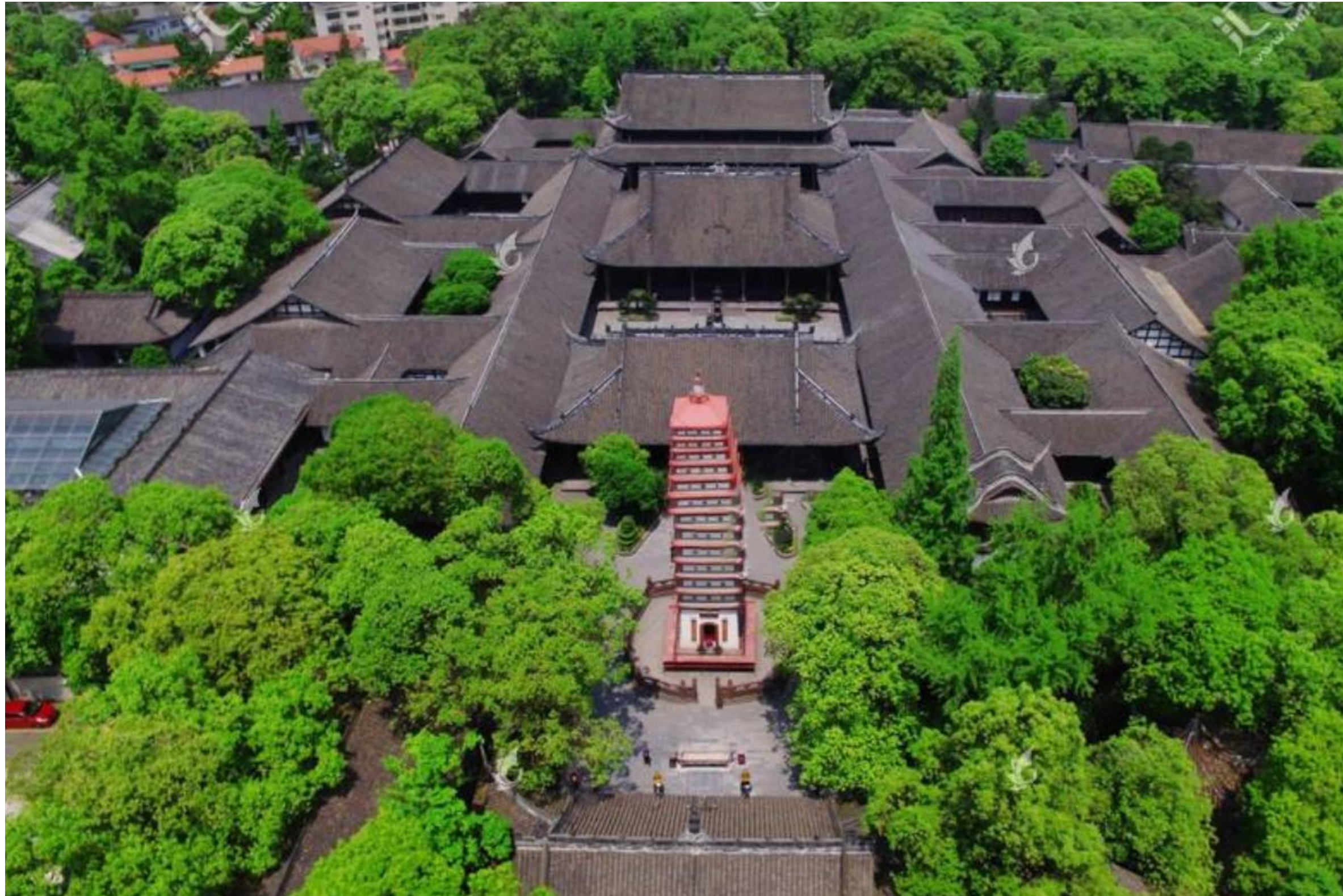
千年古刹宝光寺距酒店5分钟车程