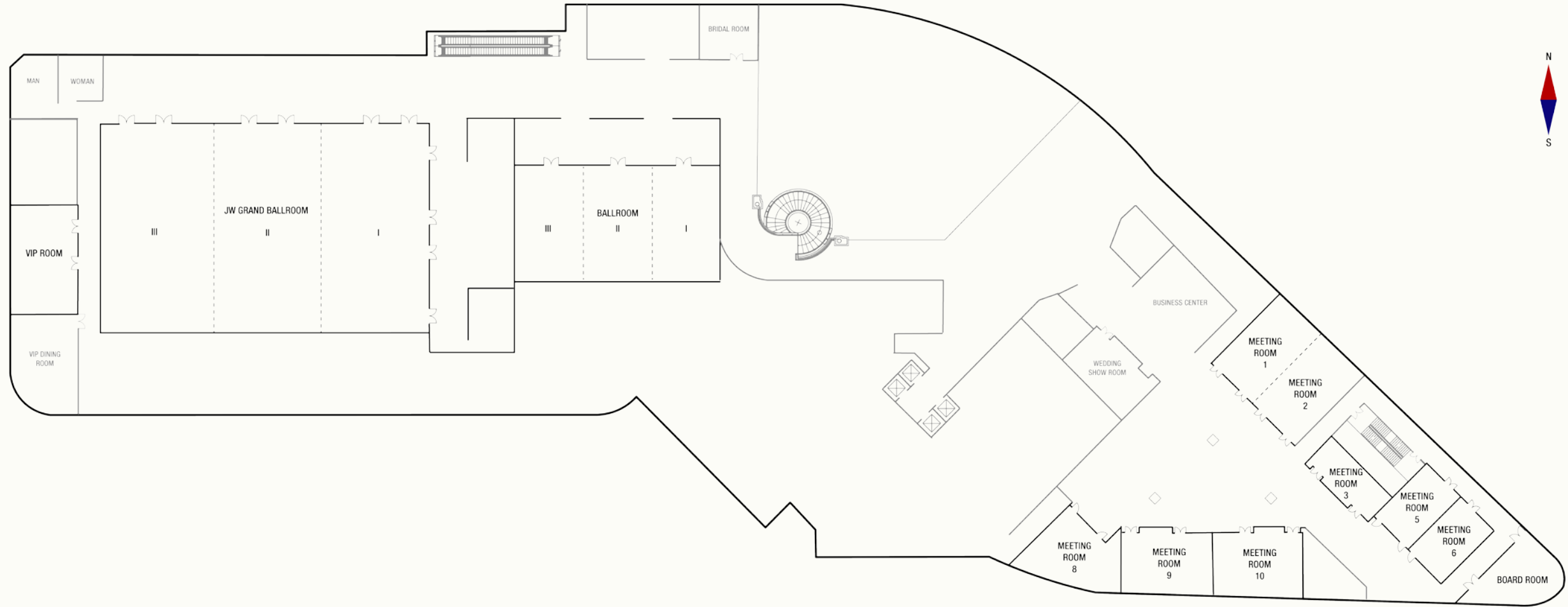
酒店2层宴会平面图