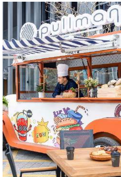
BITES ON WHEELS