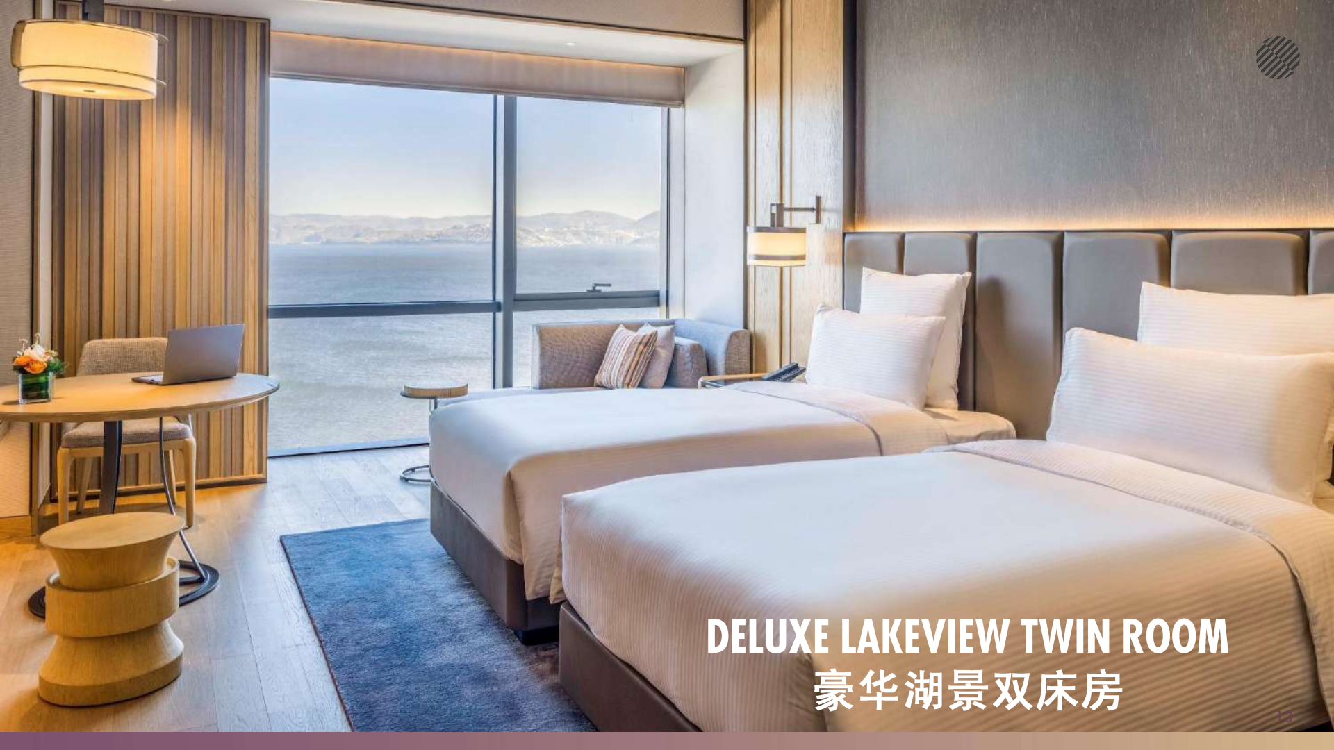
DELUXE LAKEVIEW TWIN ROOM 豪华湖景双床房