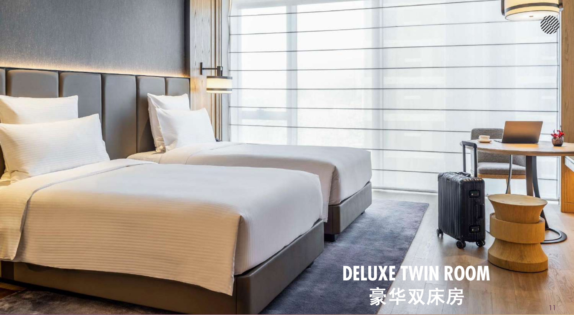
DELUXE TWIN ROOM 豪华双床房