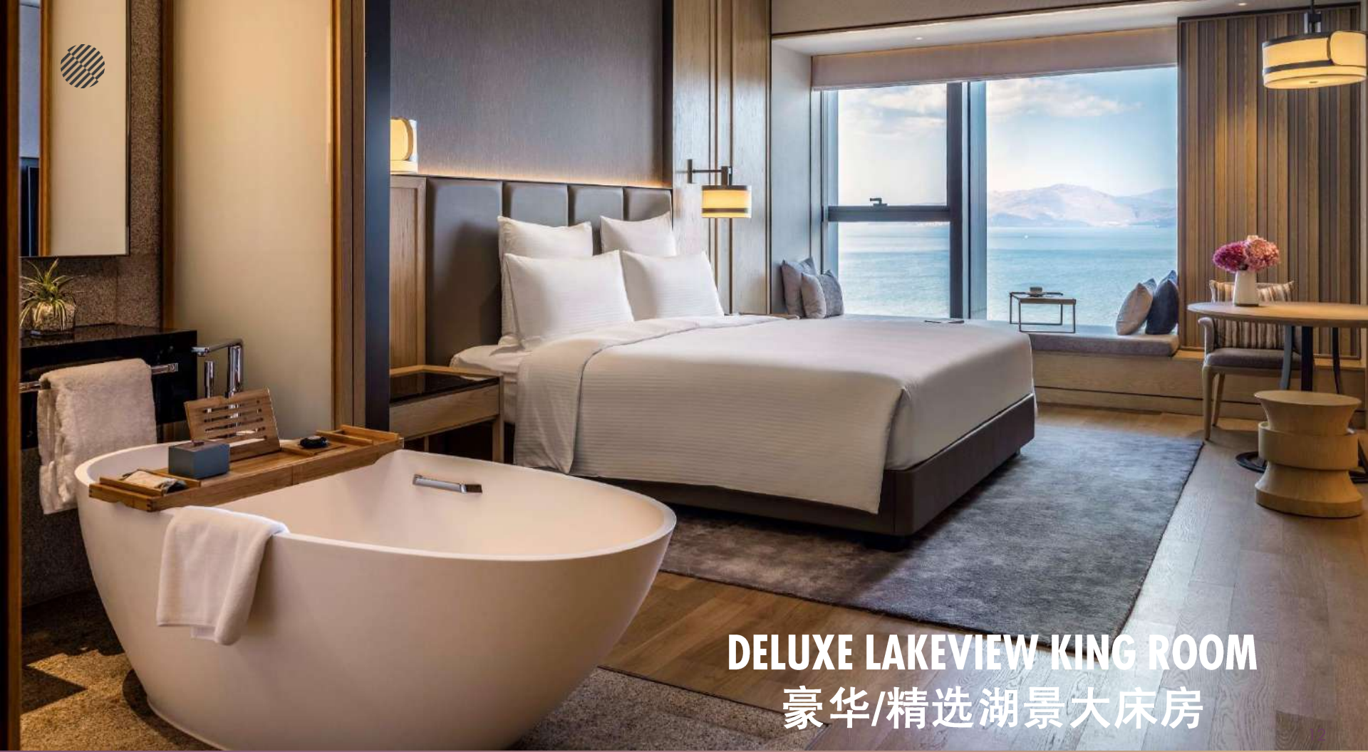
DELUXE LAKEVIEW KING ROOM 豪华/精选湖景大床房