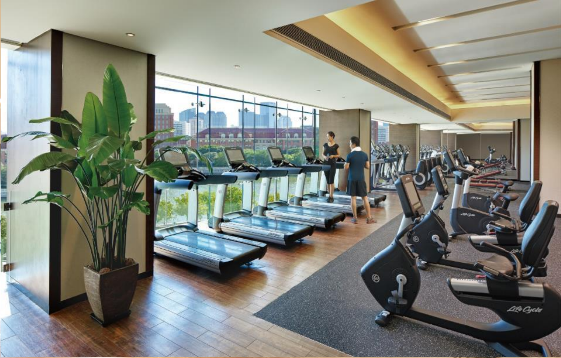
健身房及水疗中心