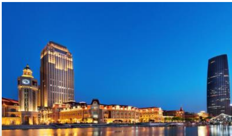
河畔旁欧式特色建筑