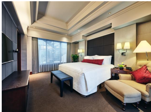
花园复式套房卧室