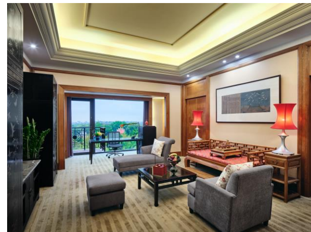
行政中式套房客厅