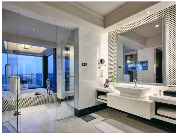
花园复式套房浴室