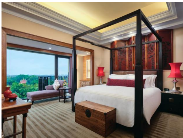
行政中式套房卧室