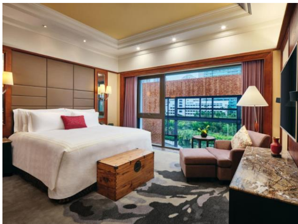
行政中式套房卧室