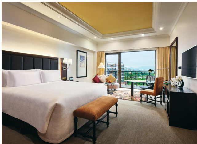
尊享房 大床 泳池景观 行政礼遇