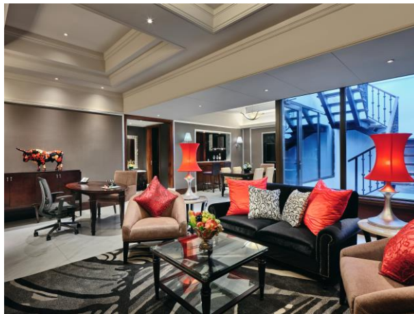
花园复式套房客厅