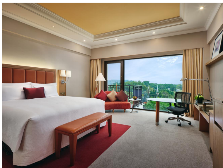
豪华房 大床 泳池景观