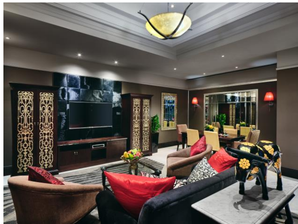
花园复式套房客厅