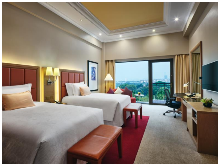
豪华房 双床 泳池景观