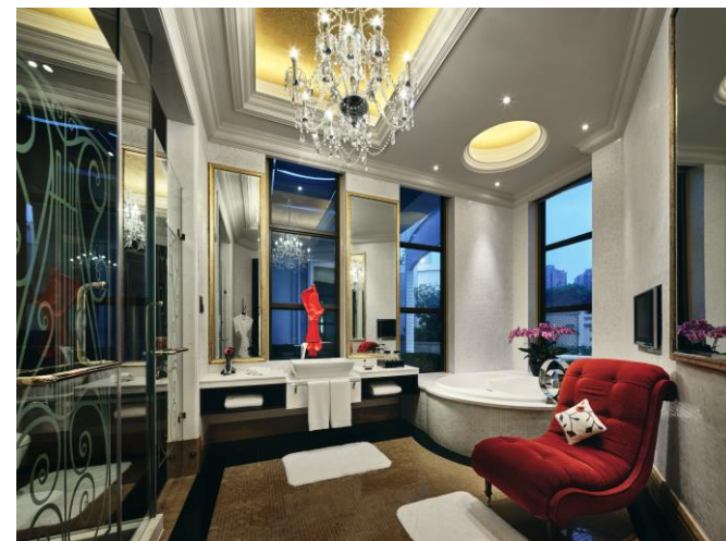
总统套房夫人房浴室