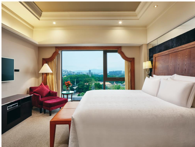
单卧套房 大床 行政礼遇 卧室