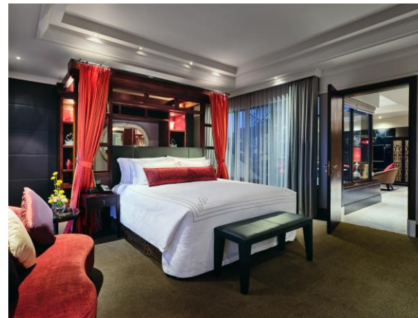
花园复式套房卧室