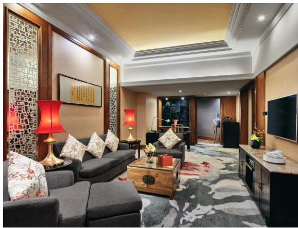
行政中式套房客厅