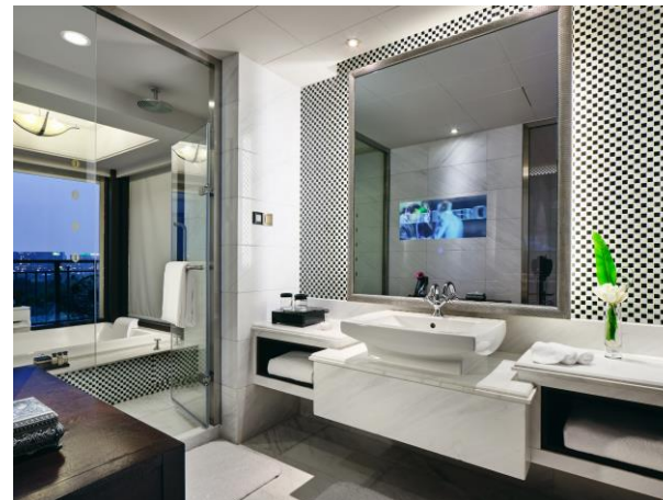
花园复式套房浴室