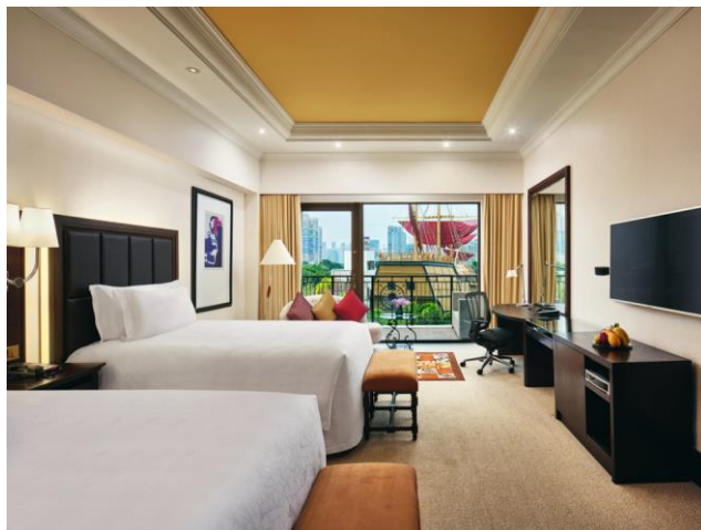
尊享房 双床 行政礼遇