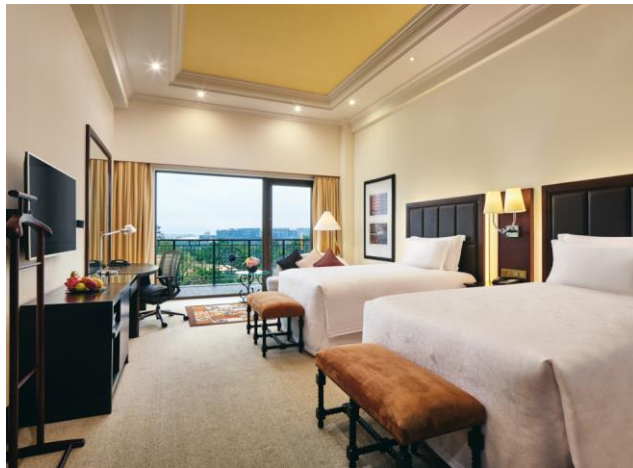
尊享房 双床 泳池景观 行政礼遇