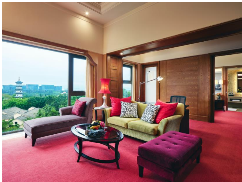
单卧套房 大床 行政礼遇 客厅