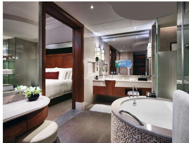
单卧套房 大床 行政礼遇 浴室