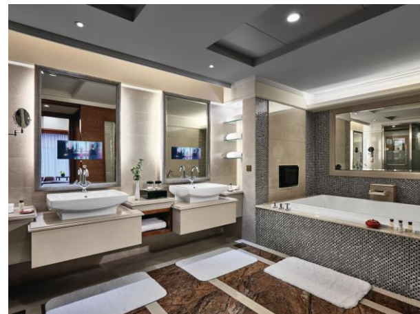
行政中式套房浴室