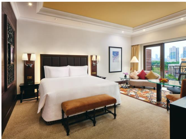
尊享房 大床 行政礼遇