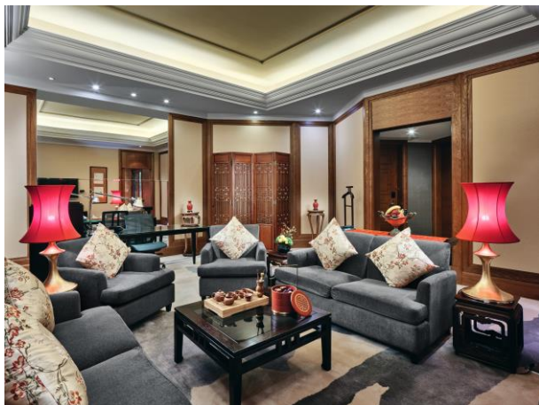
行政中式套房客厅