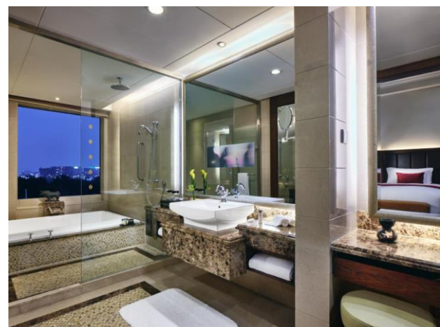
尊享房 泳池景观 浴室