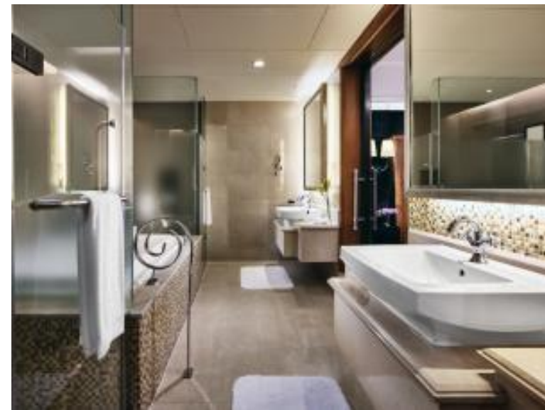
单卧套房 大床 浴室