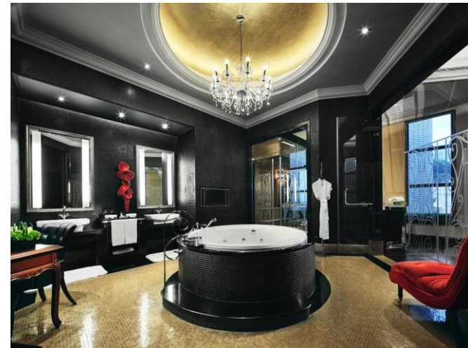
总统套房主卧浴室