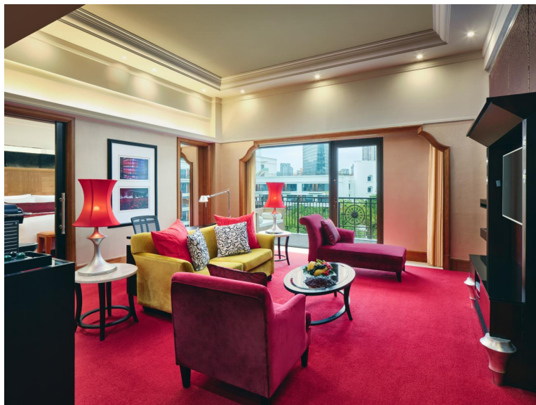
单卧套房 大床 客厅