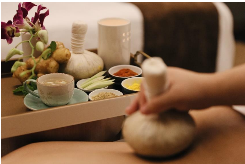
木 · 泰式草药球按摩