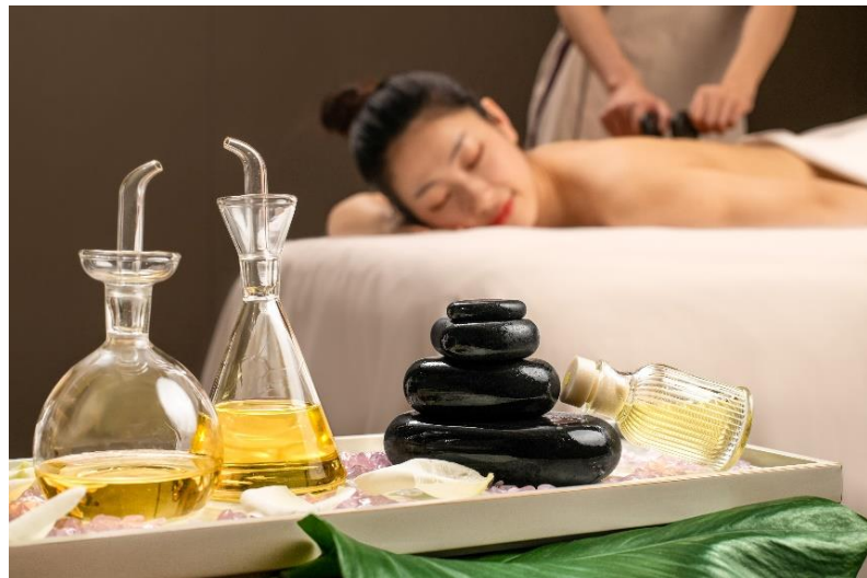
水 · 东方深层肌理热石